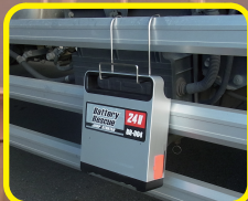
作業に便利なフック付き