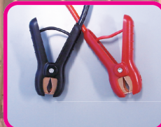
両側通電クランプ